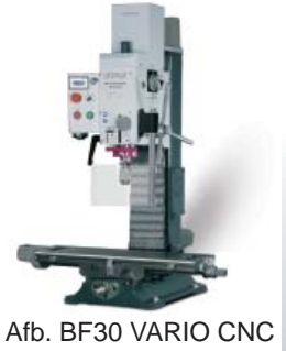
Afb. BF30 VARIO CNC