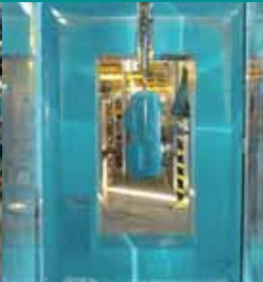
Bei 180°C erhalten AIRCRAFT® Kompressoren ihre hochwertige Oberfläche.