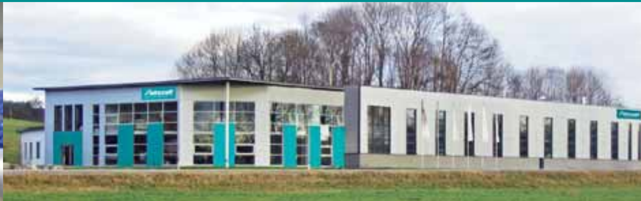
Abb. zeigt das neue 2006 fertiggestellte Fertigungs- und Verwaltungsgebäude in Österreich.