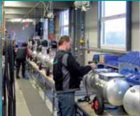
Die Montage unserer Kompressoren.