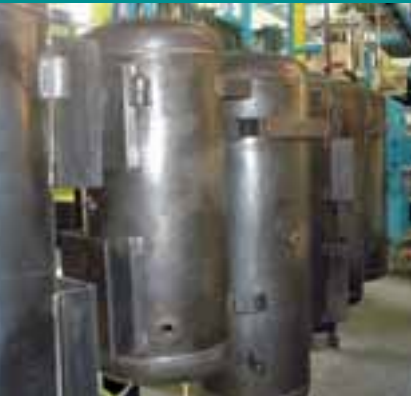
Vorbereite Kessel laufen in die eigene, umweltfreundliche Pulverbeschichtungsanlage