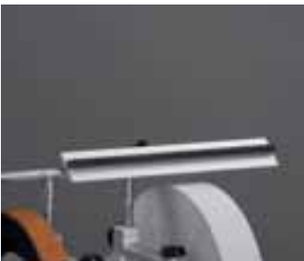
■ Support pour accessoires N° de cde 713800026