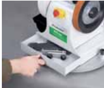
■ De série avec bac de rangement pour accessoires