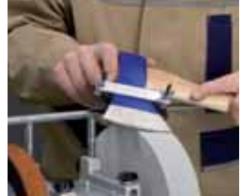
■ Affûter des haches N° de cde 713800018