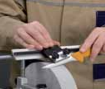
■ Affûter des couteaux N° de cde 713800027