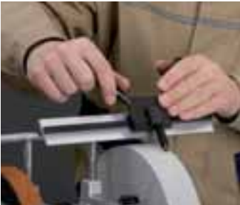
■ Alignement de la meule N° de cde 713800029