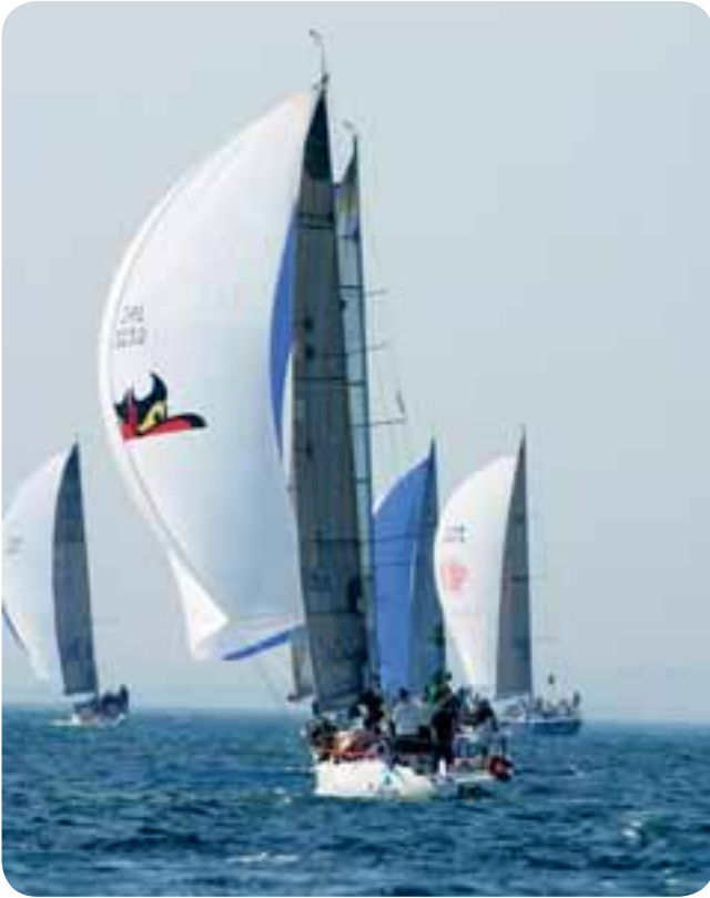
De Ierse Teng Tools importeur Eamon Crosbie met zijn zeilboot "Voodoo Child".