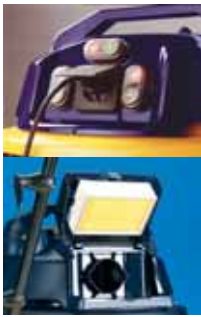
Schuko type contact max. 800W 230V