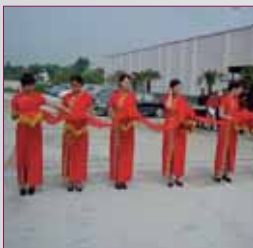
Opening van Optimum Yangzhou in 2003

Sedert 2003 produceert Optimum een groot deel van het machinegamma in hun eigen fabriek in het Chinese Yangzhou onder streng toezicht en kwaliteitscontrole van een Duitse productieleiding.