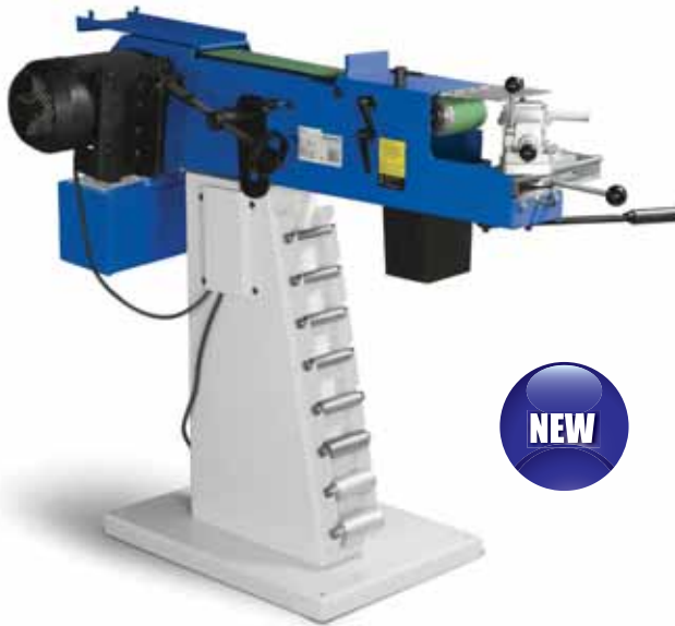
RPSM2 met optionele metalen spaanderopvangbak en slijprollen

Metalkraft. RPSM2. Slijpmachine voor metalen buizen en profielen met 2 snelheden. Hoekinstelling van 30 tot 90°, voor maten 1/2" tot en met 2 1/2". Eenvoudige instelling van de klem en wissel van de rollen en banden. Prismabek met aanslag, instelbaar zonder sleutels. Sterke motor van 3 kW, 400V. Geleverd met 1 slijpband K40 en 1 slijprol 28mm.