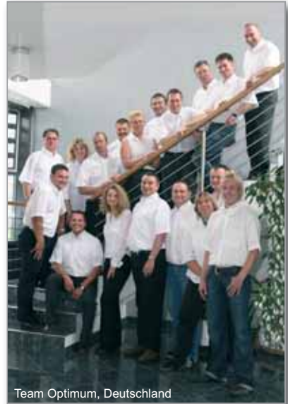
Team Optimum, Deutschland