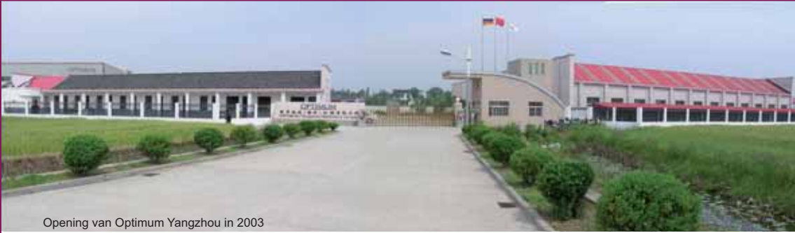
Opening van Optimum Yangzhou in 2003