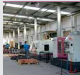
Productie op CNC machines