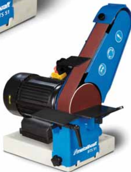
in gezwenkte positie

Metalkraft. BTS51. Universele band- en schijfschuur machine. Tafelmodel 230V met een zwenkbare arm. Geleverd met 2 slijpsteunen en noodstop.