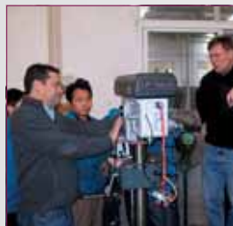
Testen van een machine