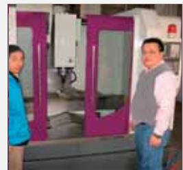
Productie op CNC machines