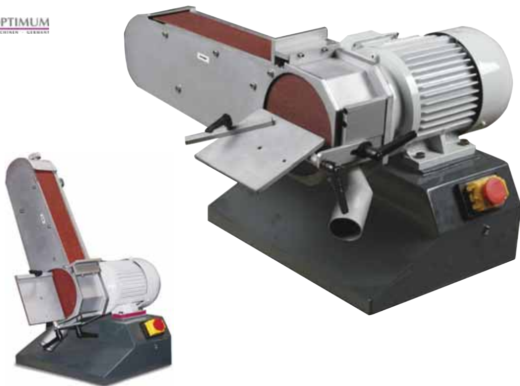
in gezwenkte positie

Optimum. DBS75. Universele band- en schijfschuur machine met een zwenkbare schuurarm. Schuurbandspanning is manueel instelbaar. Fijninstelling voor een parallelle schuurbandloop. 2 verstelbare slijptafels, klembaar met een hendel. Eenvoudige schuurbandwissel. Veiligheidsschakelaar conform IP 54 norm. Krachtige motor van 1100 W.